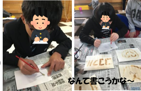
なんて書こうかな～