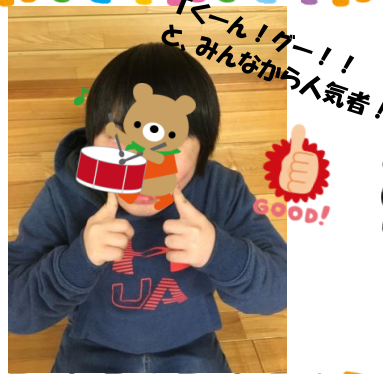
Tくん! ー! みんなから人気者!

高校1年生のTくんです。いたずら大好きなTくん^^隙あればスタッフを呼んで、いたずらしようとしています(笑)もちろん注意はしますが、憎めないTくんなので甘やかしがちなスタッフです。。。Tくんは歌がとっても上手!!夏は色んな歌手のツアーTシャツを着こなしているほど音楽好き♪教室や車内でTくんの歌声が響いています。鬼のパンツやドラえものの歌などとても上手なんですよ^^お友達とも仲良しで特に女子からモテモテ♡常に両手に華のTくんです♪また一緒に歌いっぱい歌おうね♪