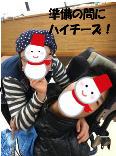
準備の間にハイチース!

今日は積雪予報!!お友達も少なくなってしまいました;;そんな中でもごはんはしっかり作ります! 大根のそぼろあんかけ、大根の塩昆布漬、大根のお味噌汁、ココ畑サラダと本当に大根づくし! ココ畑の大根は辛みもなくとってもおいしかったですよ^^