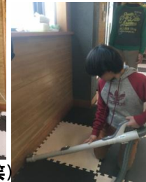
こわいと引き気味(笑)